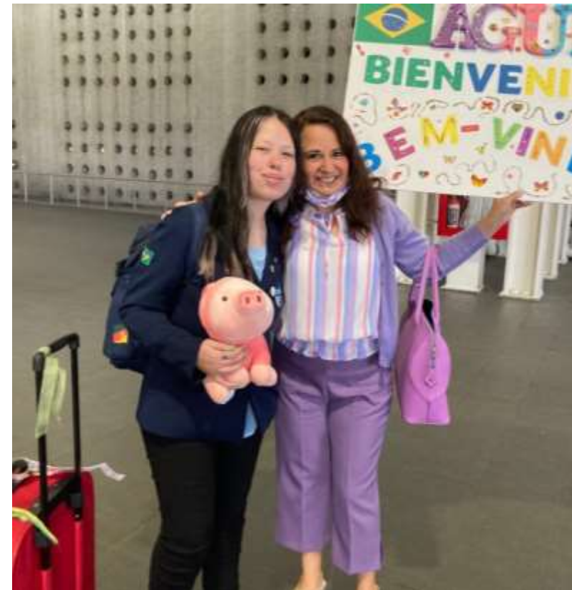
Ágatha – Custeada pelo Rotary Clube de Cachoeirinha