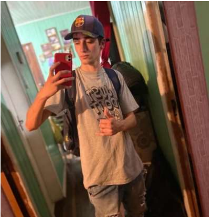
Éverton – Custeado pelo Rotary Clube Canela Inspiração